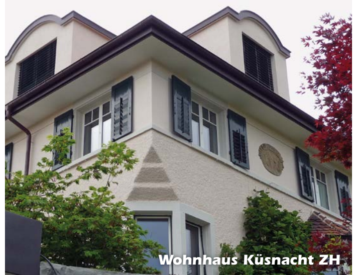
Wohnhaus Küsnacht ZH