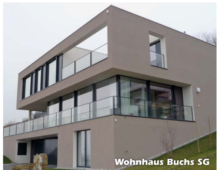
Wohnhaus Buchs SG