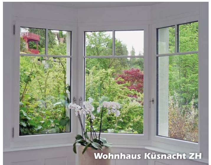
Wohnhaus Küsnacht ZH